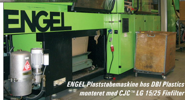
ENGEL Plaststøbemaskine hos DBI Plastics monteret med CJC™ LG 15/25 Finfiltre