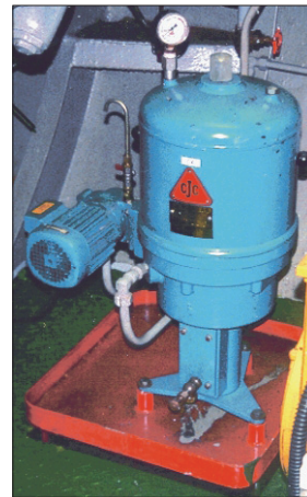
PTU2 27/27 P 用于柴油的分离