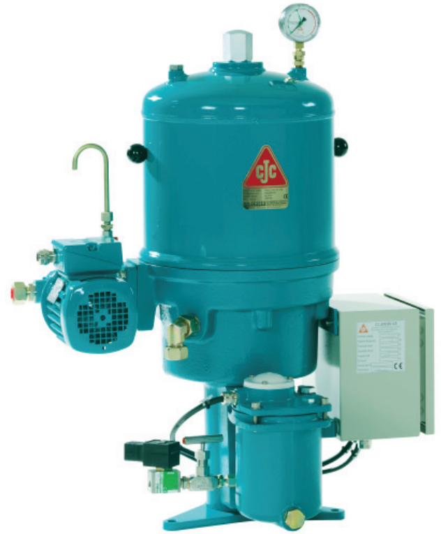
CJC™滤油除水器 PTU2 27/27 PV-E2W

所有CJC™滤芯的过滤精度等级为绝对的3微米，也就是说，98.7%大于3微米的固体颗粒以及50%大于0.8微米的颗粒体都可以在一次过滤中被挡住。CJC™深度型离线式滤芯具有高效的氧化物吸收能力。在过滤前给油品（混合油品）预热，可以防止石蜡在过滤器内凝结。CJC™滤油除水器 PTU2 27/27 PV-E2W