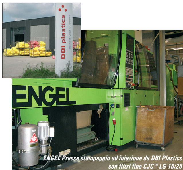
ENGEL Presse stampaggio ad iniezione da DBI Plastics con filtri fine CJC™ LG 15/25

Verificando i risultati delle analisi dei campioni di olio, abbiamo notato una pressa che ha utilizzato lo stesso olio per 16 anni ! (vedere la tabella a lato per i risultati).