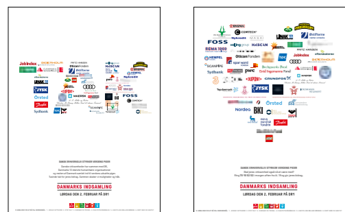
Fra 100.000 kr. deltagelse i fælles logoannonce i Børsen.