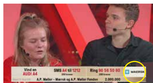
Fra 50.000 kr. crawl med logo, navn og bidrag.