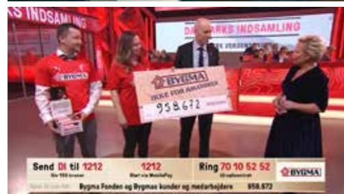
Fra 250.000 kr. markering fx. som et show-spot. (Vist eksempel fra 2017)