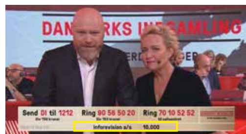
Fra 10.000 kr. crawl med navn og bidrag.